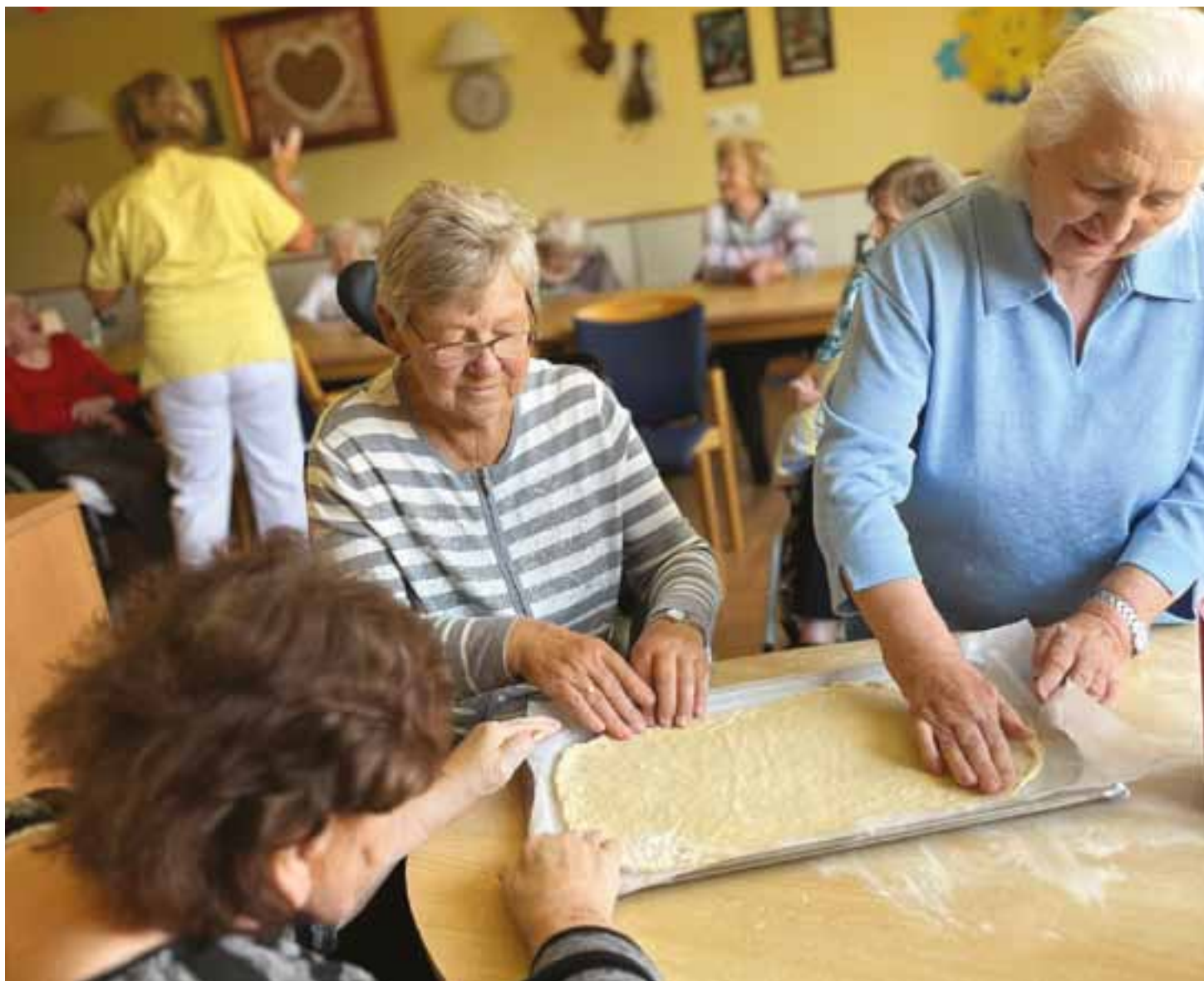
Der Herbst steht vor der Tür – dann werden wieder gemeinsam leckere Zweibelkuchen gebacken.

Jubiläum Seit 20 Jahren setzt das Pflegezentrum im Klinikum am Standort in Ebermannstadt in der Altenpflege Qualitätsmaßstäbe. Familiäre Atmosphäre wird groß geschrieben.